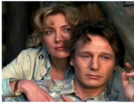
1994 NELL (Nell) de Michael Apted avec Liam Neeson