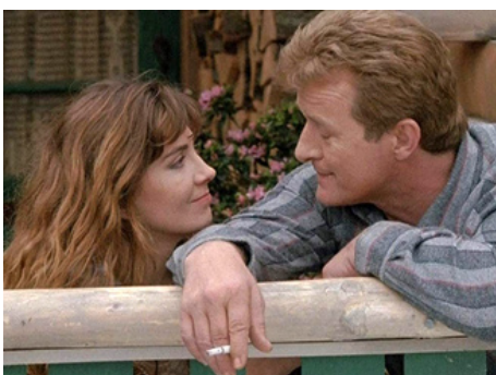
1991 COUPABLE (Past Midnight) de Jan Eliasberg avec Rutger Hauer