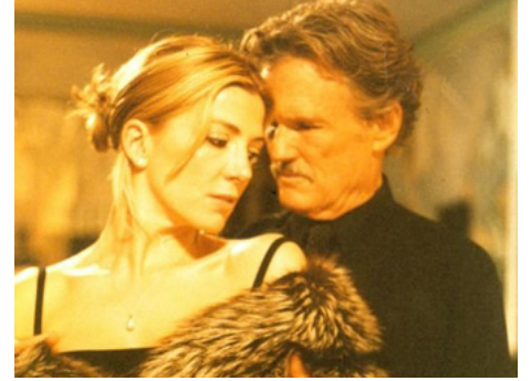
2001 CHELSEA HOTEL (Chelsea Walls) d'Ethan Hawke avec Kris Kristofferson