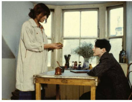
1982 EVERY PICTURES TELLS A STORY de James Scott avec Luke McKernan