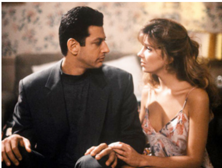
1989 RUE SAINT-SULPICE (The favour, the watch and the very big fish) de Ben Levin avec Jeff Goldblum