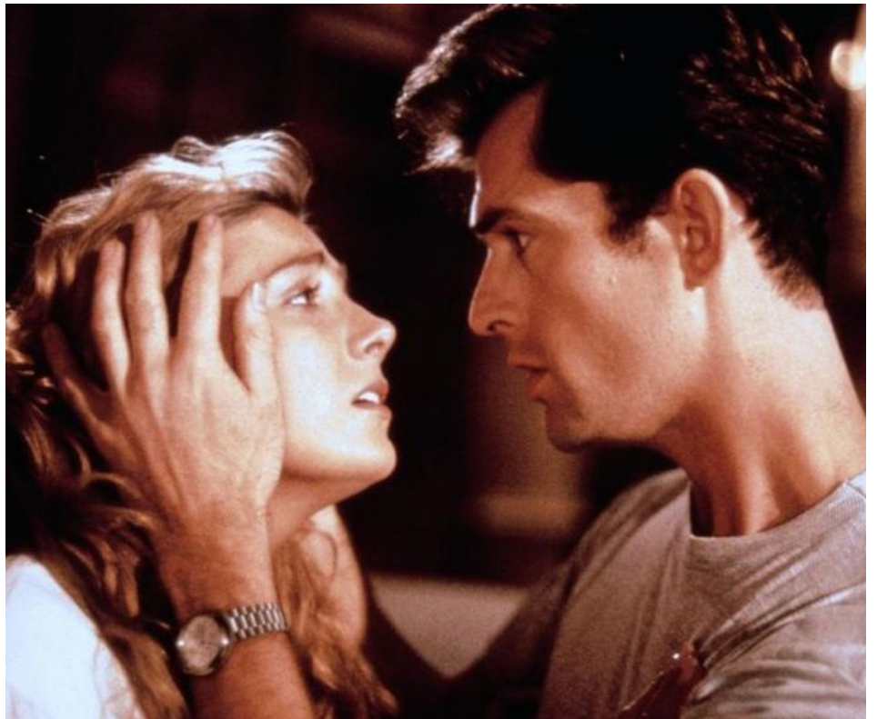
1990 ÉTRANGE SÉDUCTION (The Comfort of Strangers) de Paul Schrader avec Rupert Everett