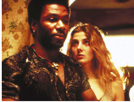
1988 PATTY HEARST (Patty) de Paul Schrader avec Ving Rhames