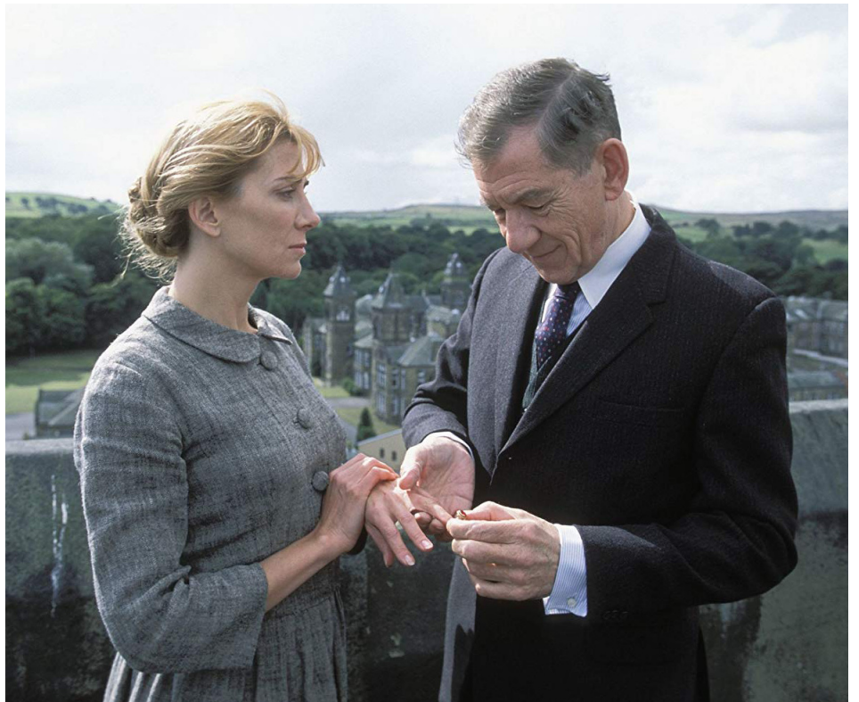
2003 ASYLUM (Asylum) de David Mackenzie avec Ian McKellen