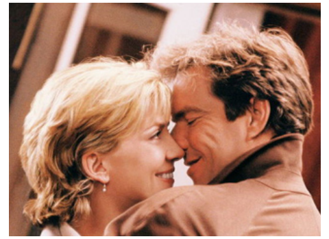
1998 À NOUS QUATRE (The Parent Trap) de Nancy Meyers avec Dennis Quaid