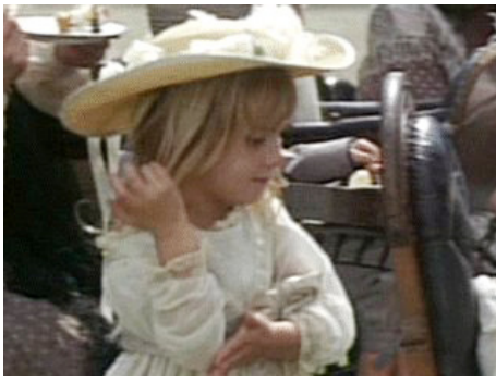
1967 LA CHARGE DE LA BRIGADE LÉGÈRE (The Charge of the light Brigade) de Tony Richardson