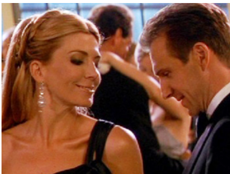
2002 COUP DE FOUORE À MANHATTAN (Maid in Manhattan) de Wayne Wang avec Ralph Fiennes