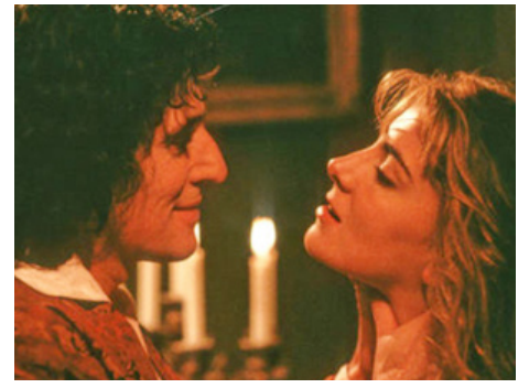
1986 GOTHIC (Gothic) de Ken Russell avec Gabriel Byrne