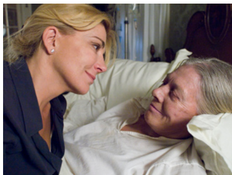
2006 LE TEMPS D'UN ÉTÉ (Evening) de Lajos Koltai avec Vanessa Redgrave