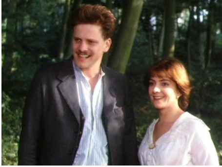
1987 UN MOIS À LA CAMPAGNE (A Month in the Country) de Pat O'Connor avec Colin Firth