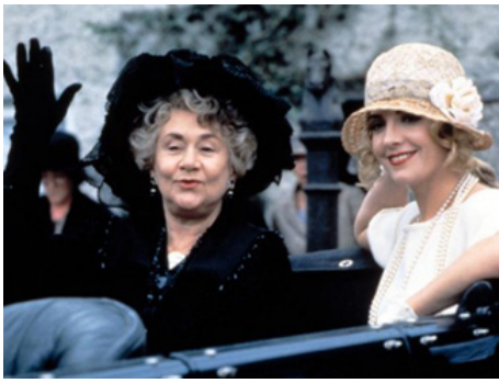
1994 PARFUM DE SCANDALE (Widow's Peak) de John Irvin avec Joan Plowright