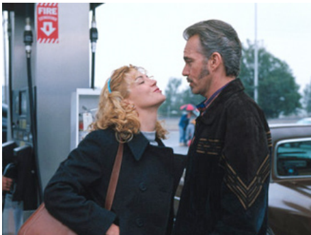
2001 UNE CHAMBRE POUR QUATRE (Waking up in Reno) de Jordan Brady avec Billy Bob Thornton