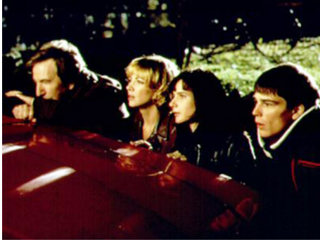
2000 COUP DE PEIGNE (Blow dry) de Paddy Breathnach avec Alan Rickman, Rachel Griffiths, Josh Hartnett