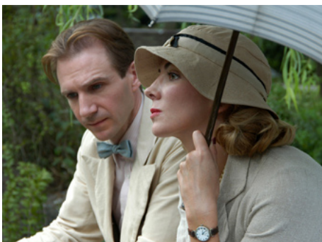
2004 LA COMTESSE BLANCHE (The white Countess) de James Ivory avec Ralph Fiennes