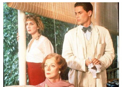
1993 SOUDAIN, L'ÉTÉ DERNIER (Suddenly, last summer) de Richard Eyre avec Maggie Smith, Rob Lowe