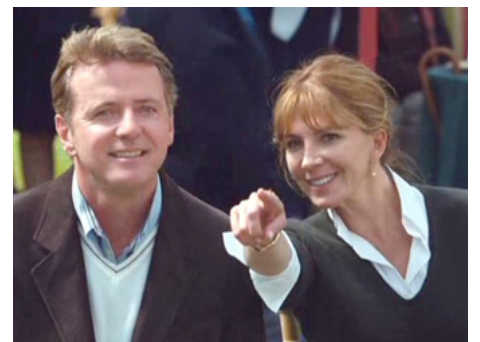
2008 WILD CHILD (Wild Child) de Nick Moore avec Aidan Quinn