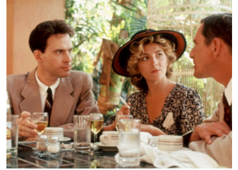
1988 LES MAÎTRES DE L'OMBRE (Fat Man and Little Boy) de Roland Joffé avec Dwight Schultz